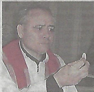
Illarraz. Acusado de 7 abusos.

El 16 de abril comenzará el juicio al cura Justo José Illarraz, acusado de abusar de 7 menores de entre 10 y 14 años cuando ejercía como prefecto de disciplina en el Seminario Arquidiocesano Nuestra Señora del Cenáculo, entre 1985 y 1993. Entre las pruebas contra el presbítero hay una carta del Vaticano que revela que, en una confesión de 1997, el sacerdote reconoció los abusos a seminaristas menores de edad.