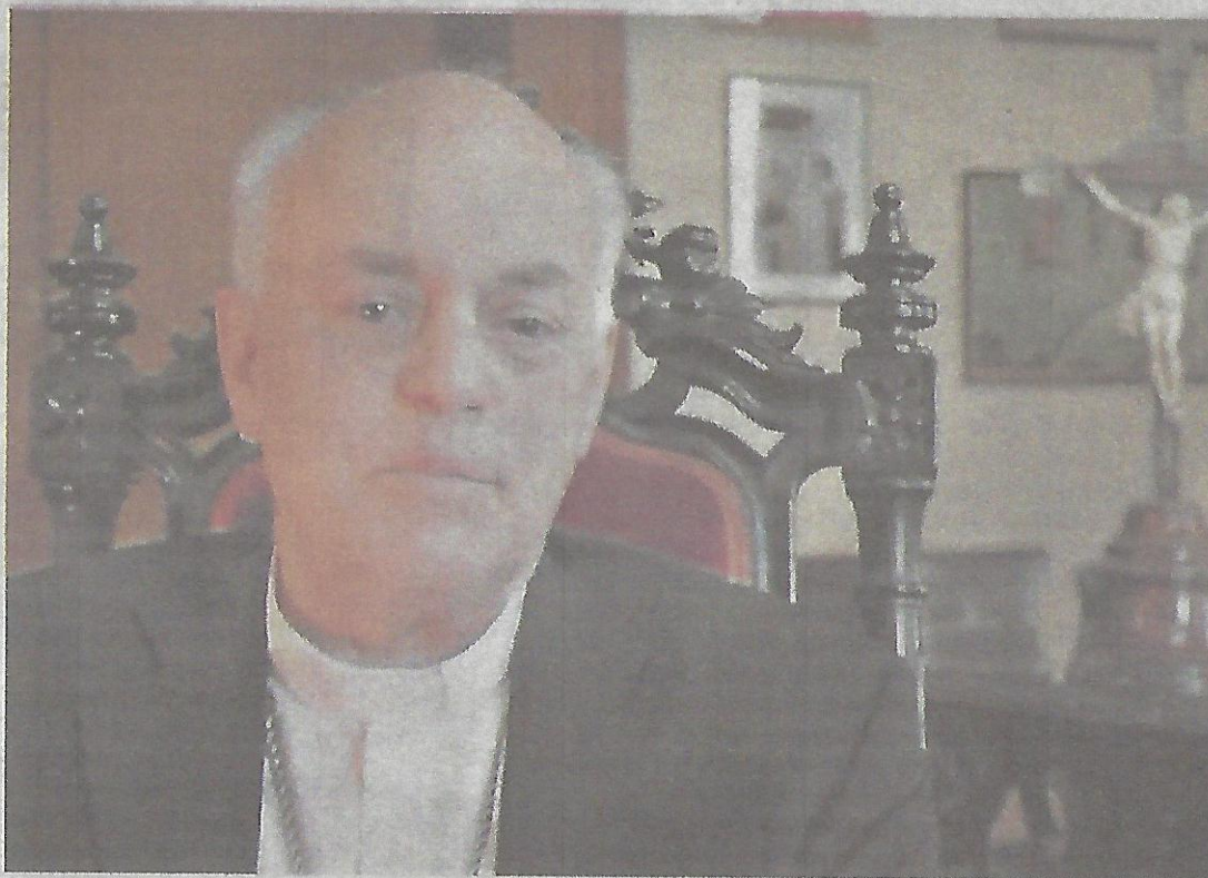
Arzobispo. Juan Alberto Puiggari aprobó la norma que indica evitar en todo momento el contacto físico.

Simultáneamente, el arzobispado de Paraná difundió un protocolo sobre los pasos que deben seguirse ante una denuncia o sospecha verosímil de un abuso cometido por un clérigo, religioso, religiosa o laico perteneciente a la institución. En rigor, se trata de una bajada del protocolo general establecido en los últimos años